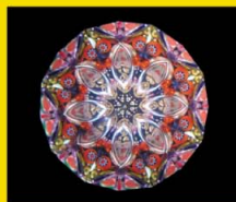
2ミラー・オイルタイプ