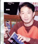
山見 浩司 万華鏡アーティスト

国際的にも高く評価され、日本を代表する万華鏡作家の第一人者、山見浩司氏の最新作品を常時展示。あなたの今までの万華鏡のイメージを変えてしまう、山見浩司・万華鏡の世界をご鑑賞下さい。